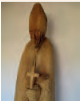
Der Hl. Wolfgang als Bischof, Europakloster Gut Aich, Darstellung vom Künstler Andreas Kühnlein/Chiemgau

Der Hl. Wolfgang, geb. 924 in Schwaben, Besuch der Klosterschule in Reichenau, Studium in Würzburg, Unterricht in Trier. Er war